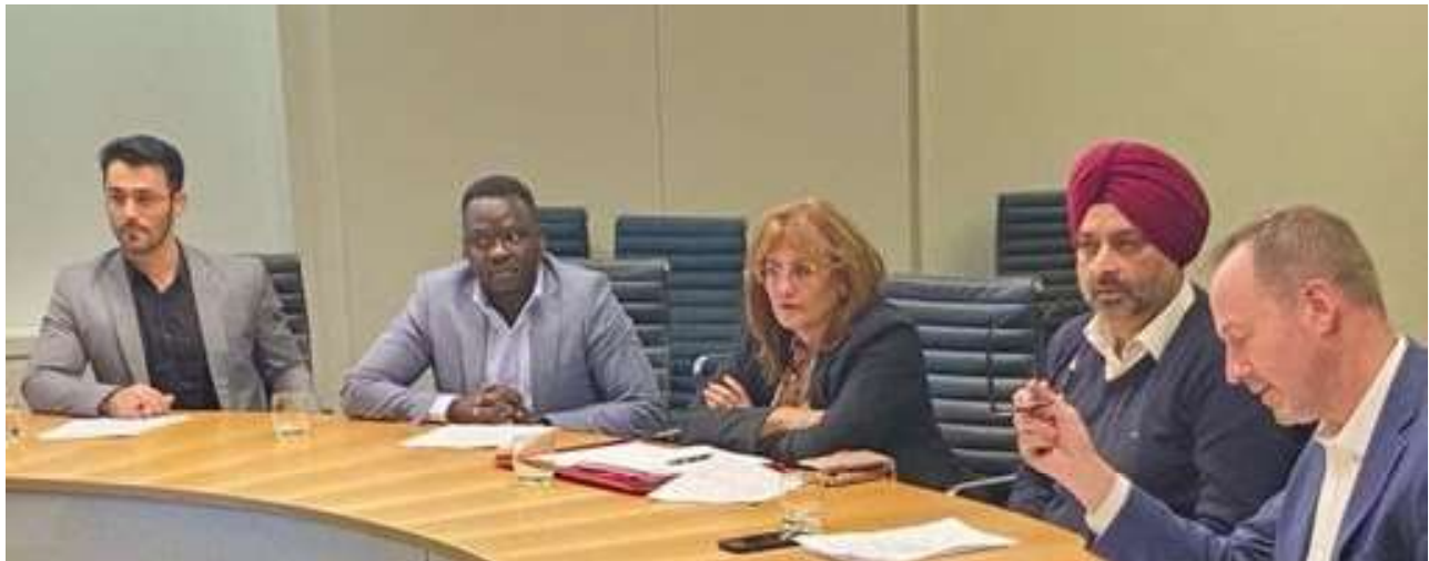
workshop held on the 2024 Immigration Bill