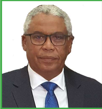
السفير عادل ابراهيم مصطفى

ولا تزال أمامهما قضايا عالقة مثل ترسيم الحدود والوضع النهائي لمنطقة اببي وغيرها .